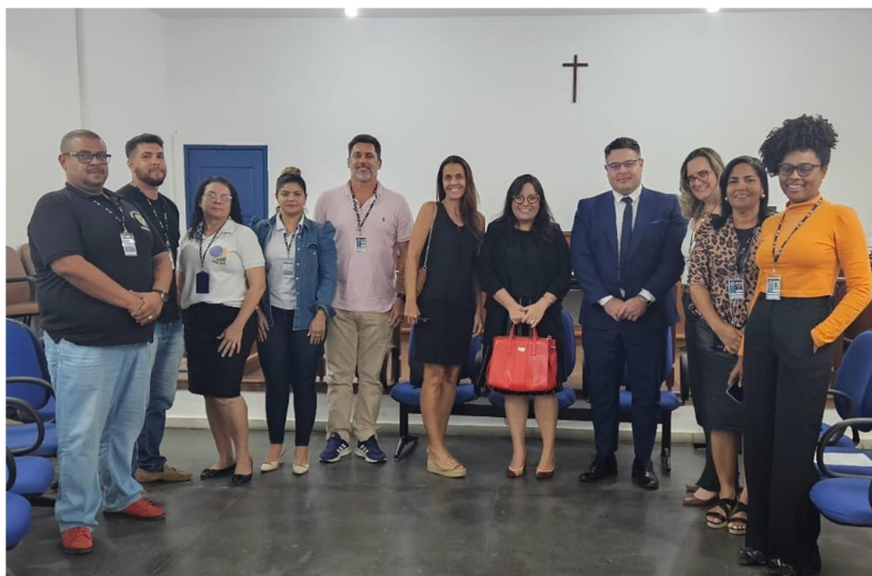
Inspeção realizada na 127ª Zona - Candeias

Em decorrência das ações vinculadas ao pleito eleitoral, as inspeções de ciclo planejadas para o ano de 2024 tiveram o cronograma reduzido de forma a não interferir no período crítico de encerramento do cadastro eleitoral (09/05/2024), tampouco nas atividades de preparação do pleito (visitas a locais de votação, cerimônia de carga e lacração das urnas, registro de candidatos, fiscalização da propaganda eleitoral, etc.), razão pela qual foram realizadas no período compreendido entre os meses de maio e julho de 2024.