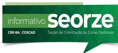
TABELA 2- INFORMATIVOS