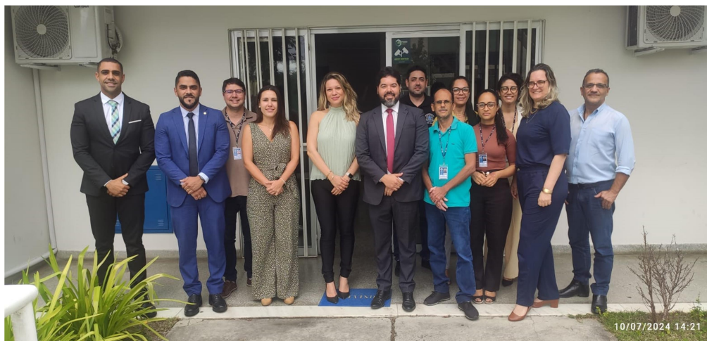
Inspeção realizada na 142ª Zona - Cruz das Almas

Das inspeções planejadas para o ciclo 2023-2027, destaca-se que 31 (trinta e uma) zonas eleitorais foram devidamente inspecionadas em 2024.