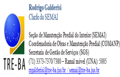
4-Assinatura_chefe.PNG 33 KB